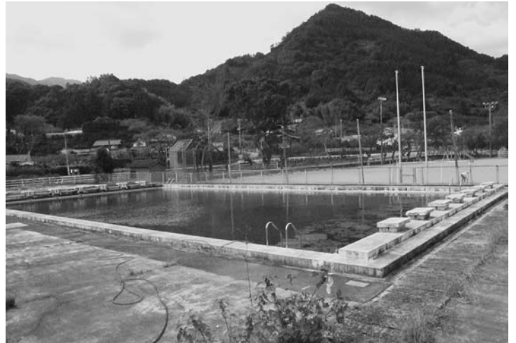
夏休みに使用できなかった横小プール

もないが、それが原因で今回の事故が起きたと思われる。また、病院の外壁塗装についても昨年、予算計上していたにもかかわらず執行されないままに終り、今年度も予算を議決しながら執行の見通しが立っていない。町長の姿勢に問題があるのではないか。