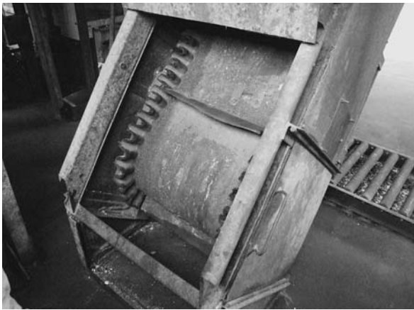
▶ 不燃物処理場のベルトコンベアを修繕