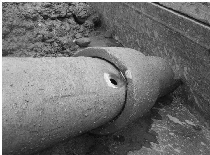
老朽化している簡易水道の石綿管

石綿管については、国も動物実験を行ない、また、世界保健機構も人体に影響はないと公表している。