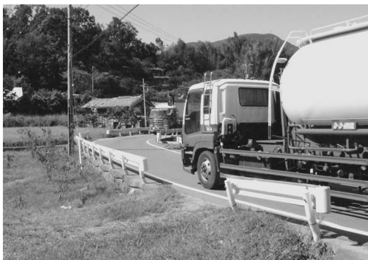
大型車が対向できない阿南・勝浦線