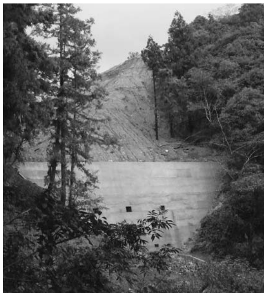
二世帯が避難した与川内の土砂投棄現場

町長 補助金のある予算は執行できているが、町単独予算の場合、執行に当たって、もう少し安くならないかと私なりに考えて、つい遅れてしまっている。