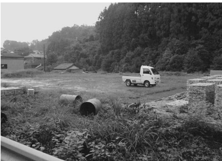
今後どうする 棚野の開発公社所有地