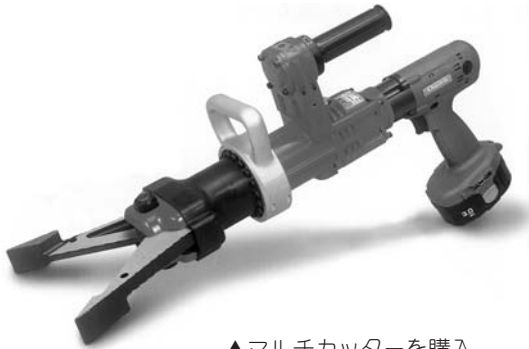
▲マルチカッターを購入