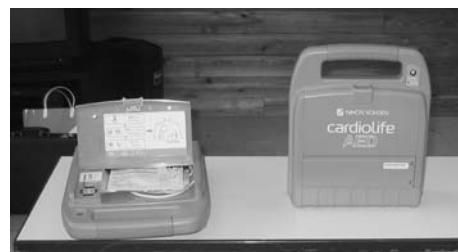
AED（自動体外式除細動器）