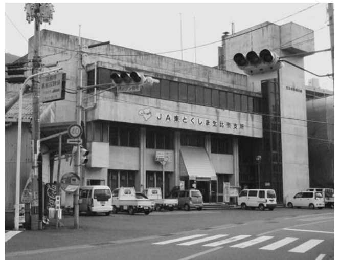
避難所に保健師の派遣を