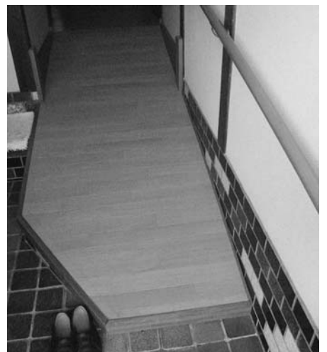
バリアフリー工事は良心的な業者

答 町長 悪徳業者対策は担当課において対応しているが、広報等でも周知徹底して相談体制を充実させて行きたい。