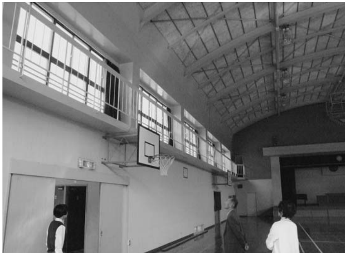
▶耐震工事が必要な横小体育館

九月定例会は、十三日から二十九日までの十七日間開かれ、三月議会で予備費とする修正案を可決していた県町村会人権対策特別会計負担金を質疑・討論のあと、賛成多数で可決。各会計の補正予算、林道管理条例、議員提案の意見書などを全会一致で可決しました。また、平成十六年度各会計の決算認定を総務産建常任委員会に付託しました。 一般質問は八議員が登壇、町の姿勢をただしました。