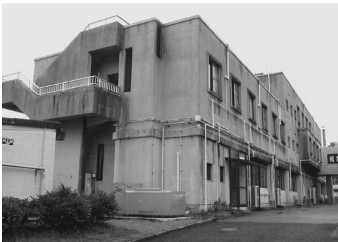
急がれる病院の外壁塗装

島建設課長 自立計画策定の準備段階で、どう経費削減するかとの協議の中で、災害時の土砂取り除きなどの作業を直営でしたらどうかとの意見が出た。