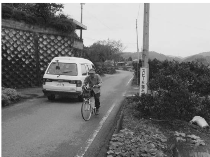
家台・中山線の早期改良を