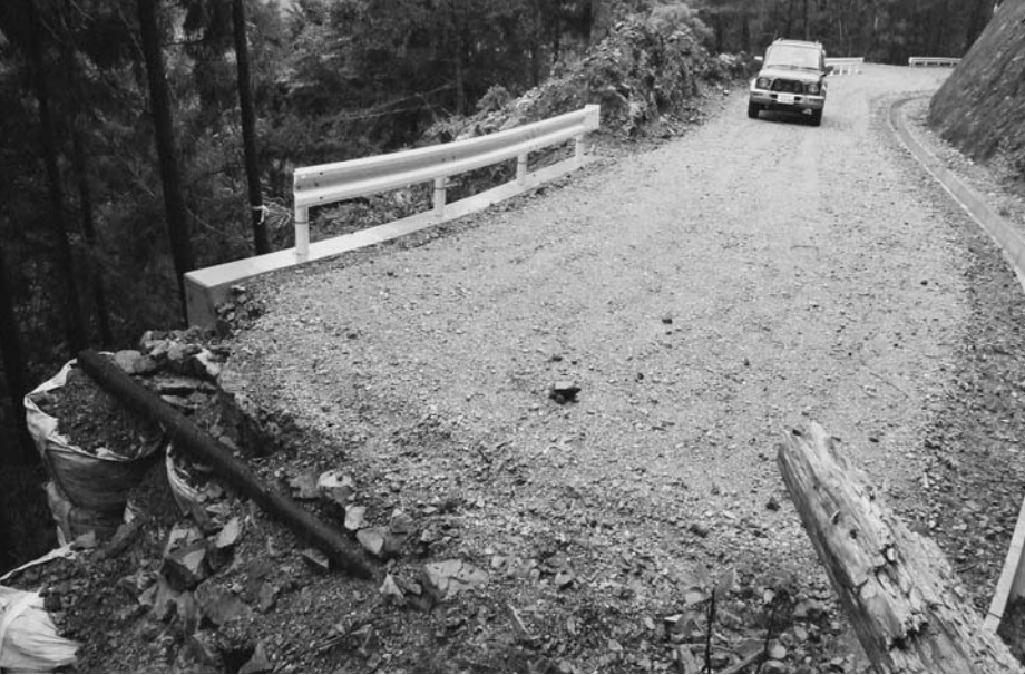
長期計画の立川・相生線