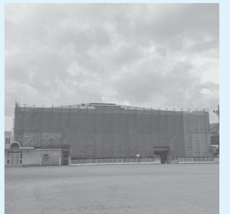
工事中の生小体育館

バリウム鋼板での施工に変更した ため予算の増額となった。工事は 10月に発注し、令和5年1月には 完成する見込みだ。