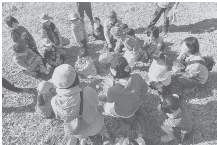
さかもと森の学校 体験会

教育機会の確保に向け、状況に応じた支援策について、現状の取組を含め調査研究し、可能なものは実施したい。