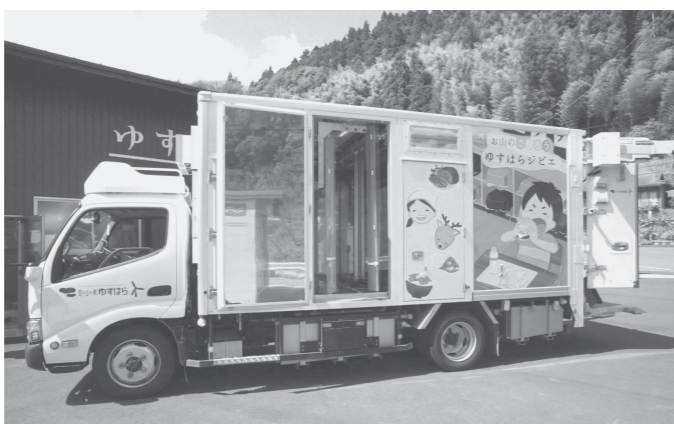
ゆすはら稼働中のジビエカー（高知県 梶原町）