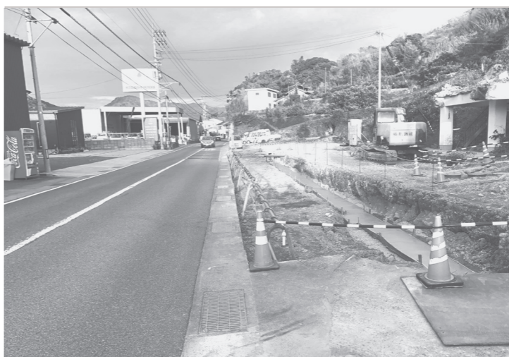
工事完了はいつになるか