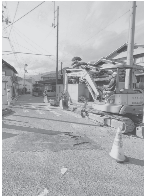
進む配管取替工事（中横水道榎瀬地区）

点で漏水量は25トン ／時だった。中山倉 瀬地区で10月中旬に 漏水調査を行い、10 トン／時の漏水を発 見し修繕工事を行った。