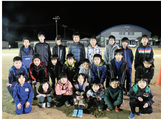
毎週 水・金曜 午後7時～8時 勝浦中学校グラウンドで練習中

徳島東工業高校陸上部を卒業後、日垂化学工業に入社し、陸上部に所属。徳島駅伝勝浦郡チームで主将、監督を経て、勝浦郡陸上競技協会副会長。現在は選手として活動する傍ら、陸協ジュニアを指導。