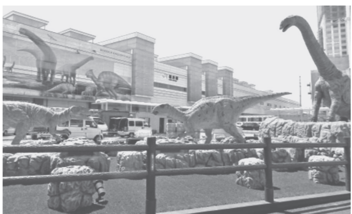
福井駅前のモニュメント

山口 町では恐竜のイベントが数 多く行われているが、大人のアイ デアだけでなく、子ども達の提案 やアイデアを盛り込んだイベント