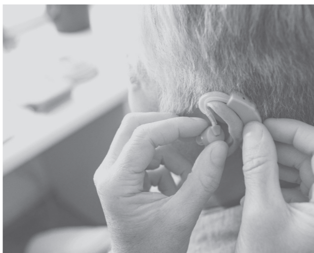
聞こえを維持し認知症対策