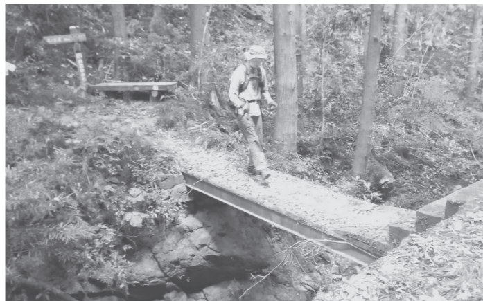
四国の道「危険で怖い」