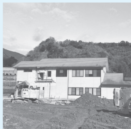
移転先の旧・デイケアコスモス

今回は移転に伴う工事費のみ計 上している。新しい事業について はこれから考える。