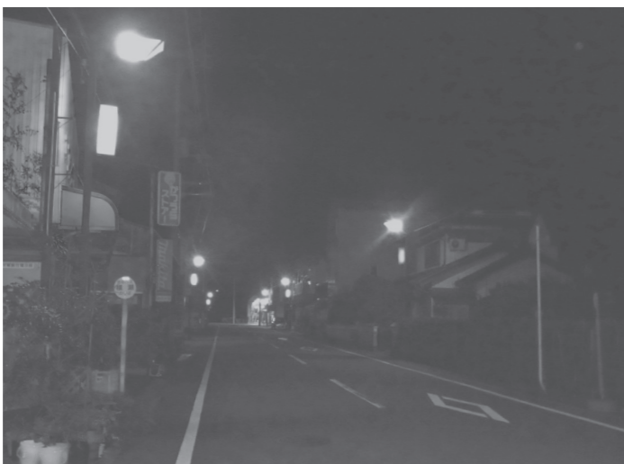
勝浦中央商店街の夜