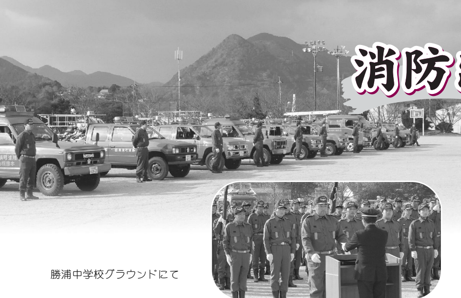
勝浦中学校グラウンドにて