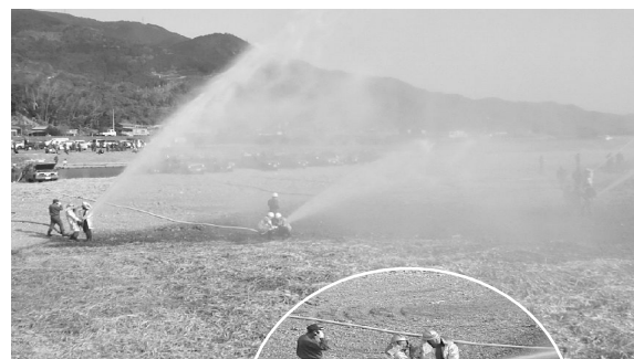
星谷橋下流河川敷にて放水訓練