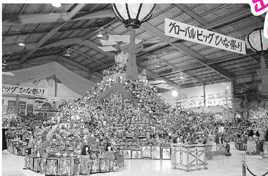
着々と準備が進む人形文化交流館