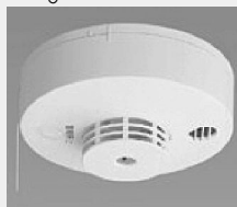
住宅用火災報知器

平成二十三年五月三十一日までに、住宅用火災報知機の設置が消防法により義務付けられています。しかし、全国的に設置が進んでいない現状です。このため、勝浦町では町内のすべてのご家庭に一台は火災報知機を設置する事業を行っています。