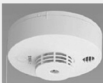
住宅用火災報知器

消防法により平成二十三年五月三十一日までに既存住宅に設置が義務つけられている火災報知器ですが、設置の普及促進並びに住宅火災による犠牲者を出さないために勝浦町では各家庭に一個ずつ火災報知器を無料配布します。