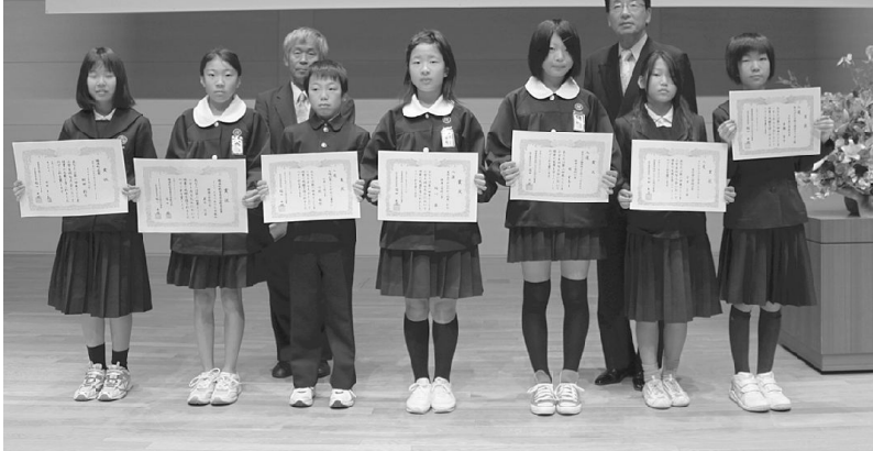
中田町長、稲井教育長、そして勝浦町の受賞者の皆さん