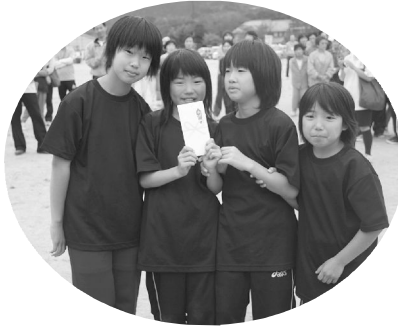
四人五脚：優勝 勝浦キッズMBBC女子B