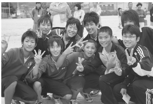
大縄跳び：優勝 TEAM WE♥勝中