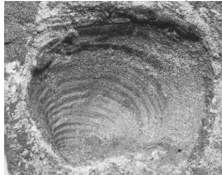
パノペア(羽浦層)1億2千万年前

また、お手元に古い写真があれば是非展示させてください。10日まで受け付けしています。