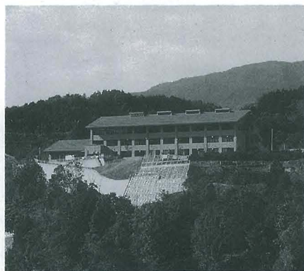
徳島医療福祉専門学校