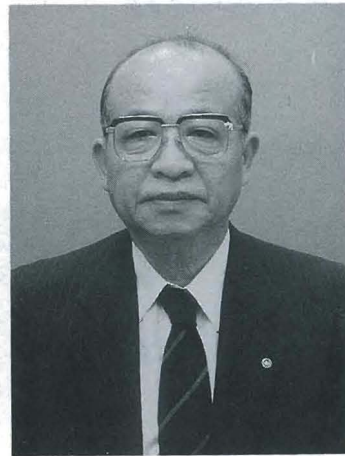
前勝浦町長 桜木 義夫