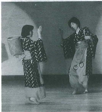
▲昨年の芸術祭から