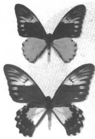
アンフリサスキシタ アゲハ (インドネシア ジャワ島)

国内・国外から集めた、珍しいチョウや魅惑の羽根をした美しいチョウをみなさんに紹介したいと思います。