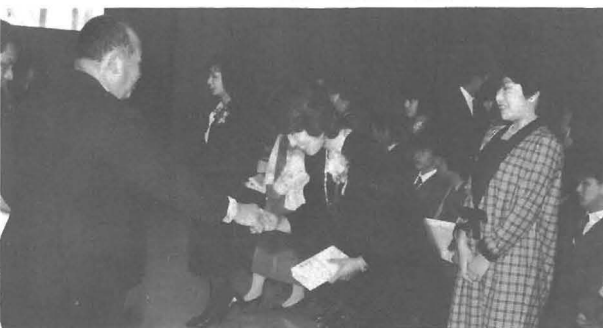
成人式で参加者を祝福する桜木町長