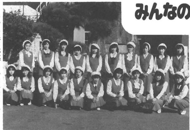
みかん娘に応募されたみなさん