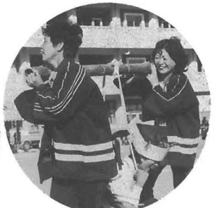
ウーマンパワーは嫁さんはおかごで