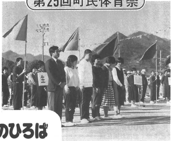
町の花・木で表彰を受けられたみなさん