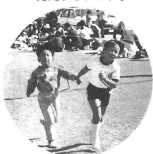
健康マラソンで完走するチビっ子