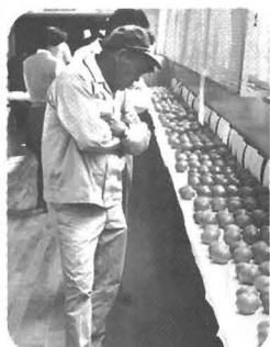
世界の果実展ではみんな真剣でした