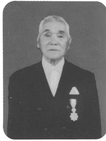
勲六等単光旭日章