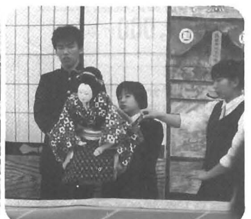
勝浦園芸高校生徒による浄瑠璃