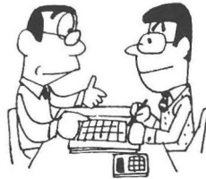
申告が始まります

書、身体障害者手帳、医療費領収書、源泉徴収票、その他申告に必要な書類。 注意 徳島税務署から所得申告(納税相談)について呼び出しを受けたかたは、指定された期日、時刻、場所を確認のうえ必ず申告してください。なお期限内に申告されないときは、税務署や町において所得を決定しますがこの場合諸控除が認められず、また不申告加算税や延滞税も納めなければならないこととなりますから、必ず期限内に済ませてください。