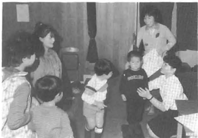
農村婦人の家で行われた3歳児健康診査