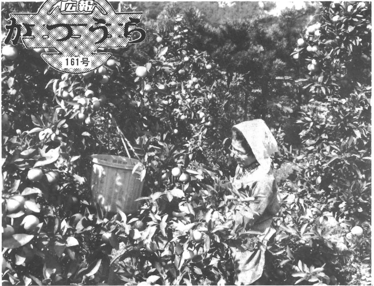
みかん取りに精を出す 農家の主婦（今山）