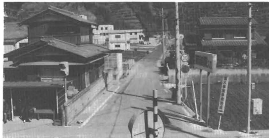
駐車禁止に指定された町道八石線

質 結婚問題が深刻になってきているが何か策はあるか。 答 この問題を解決するには、まず、住宅の確保が必要であると考えるので、県営住宅や住宅公供公社住宅を町内に建設するよう検討し、実現に努めたい。