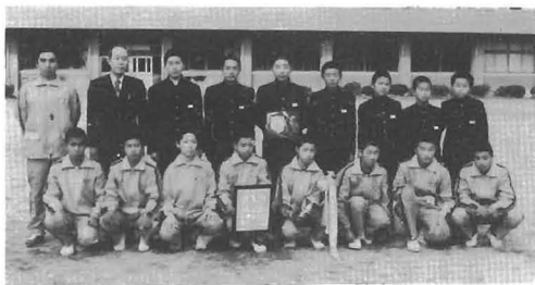
勝浦中陸上部のみなさん

勝浦中学校からはA、Bチームが参加した。各選手はPTA会長、体育後援会長、学校長、父兄ら多数の声援を受けるなか