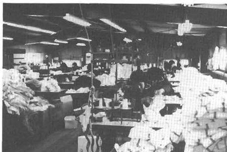
勝浦縫製で働く婦人方

質 町民の負担を軽くする方法として、予防衛生の強化である愛育班を育てているが、働く婦人が増えてくると活動がしにくくなるのではないか。 答 働きに出られているかたに役員としての負担はかなりか