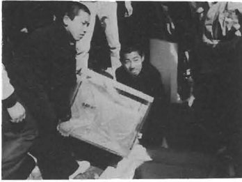
タイムカプセルを埋める勝中卒業生