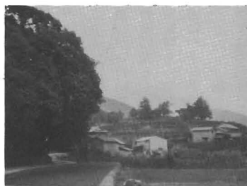
現在の五所と観正寺

さて、観正寺であるが、古老たちの言い伝えによると、鶴林寺に照寂上人なる任職がいたが酒色に溺れ、僧籍にありながらしばしば佛道諸事が疎かとなり、ついに藩命により追放となり、九才の年若いわが子を残し下寺の観正寺に隠居したと言う。当時観正寺は田畑が八反歩余りと付近一帯の広大な山林が寺領で