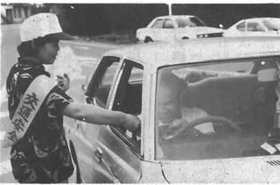
交通安全推進のため運転手にパンフレットを配布する母の会役員

六月十一日、勝浦町交通安全母の会連合会理事会が開催され、新しい役員が決まりました。