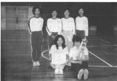
▷女子優勝は中角チーム