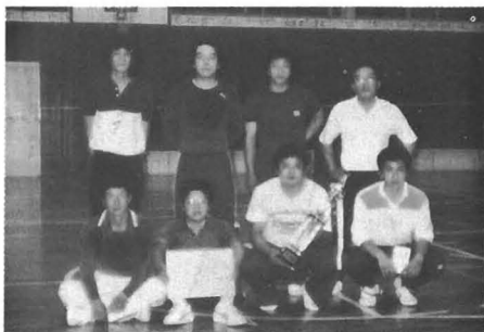
▷初優勝の男子棚野チーム