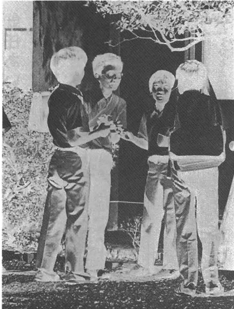
子供の行動に眼を向けよう...

町民みんなが、一人ひとりの子供の行動に眼を向けて、正しい方向に導いてほしいものです。1 家庭では子供に計画的な生活をさせる。