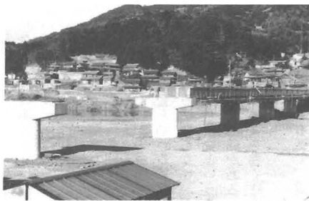
もうすぐ完成の勝浦中央橋