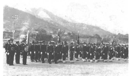
1月15日に行われた出初式に集合した240人の消防団員