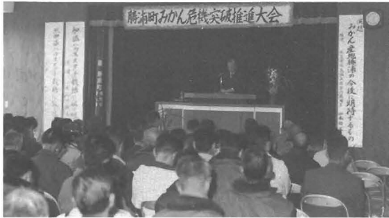
1月20日に開催されたみかん危機突破推進大会

大会の主旨説明や、今後町としての取り組みの姿勢についてあいさつをしたあと来賓のかたがたから激励の言葉をいただき、続いて、農業振興目標の説明と事例発表として、ハウスメダチの栽培に熱心に取り組んでいる