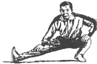
深く屈伸するが決してはずみをつけない

勝浦体協陸上部では、町民の健康づくりの一環として、毎年行っている体力テストを実施します。