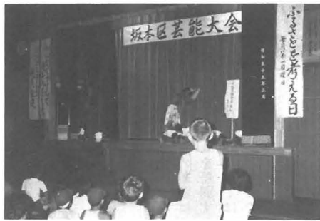
7月24日に行われた 坂本地区の芸術大会

私たち坂本地区は、去る二月末の凍害により、みかんに大きな被害を受け、みんな心が沈みがちです。幸い町から「ふるさとを考える日」のモデル地区の指定を受け、全区民あげて取り組んでいます。