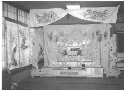
このほど新調された祭壇

この使用料は、祭壇の償却費と維持管理費等に充て、格安の値段でご奉仕するもので、ご不幸のときにお役立ていたします。