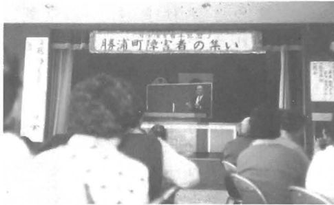
国際障害者年の記念行事として行われた勝浦町障害者の集い（4月18日）

自由な生活を送っています。 近年、平均寿命が延び、高齢化が進むなかで、脳卒中などの後遺症による障害者や交通事故、労働災害などによる障害者が年