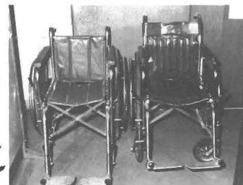
社協で用意している車いす