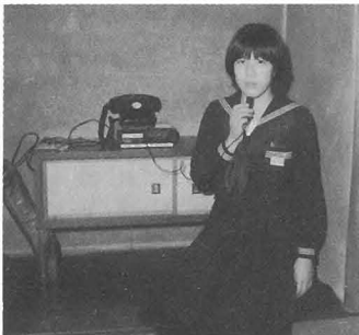
▷勝中に贈られたテレホンサービス設備

学校と家庭との連絡を緊密にするため、勝浦中学校は十二月一日から保護者向けに学校の行事などを知らせる「勝浦中学校テレホンサービス」を始めました。