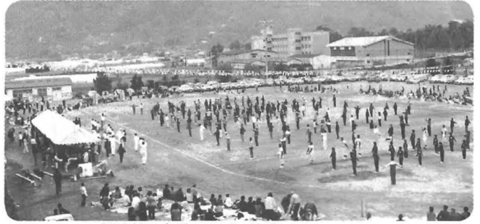
△ 競技前に全員でラジオ体操