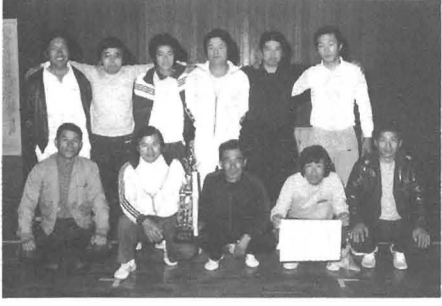
▷男子の部で優勝した与川内チーム