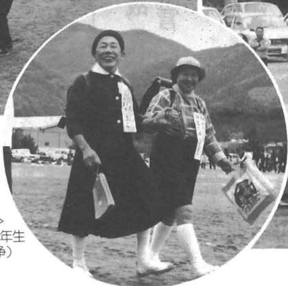
▷ 10年前にもどって ほくたちピカピカの1年生 (婦人会のきつけ競争)