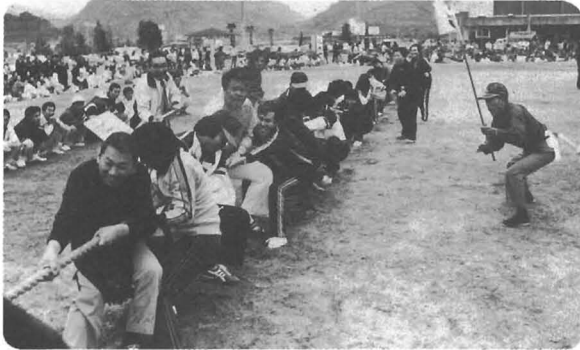
△ それ引き、やれ引きエンヤー・エンヤー

文化の日の十一月三日、恒例の町民体育祭が勝浦中学校グラウンドで開かれました。 前日の雨で一時は開催も危ぶまりましたが、関係者の前夜からのグラウンド整備により、予定どおり開催することができました。 プログラムは、自由参加の借物競争、健康マラソン、ラーメン喰い競争などのほか、老人会、婦人会の競技、また、今年国際障害者年を記念して、身障者会による目かくし競争も行われるなど、みなさんに積極的に参加していただき楽しく終了することができました。 町民体育祭は、地域住民の健康増進と心のふれあいを願って開かれるものです。この日だけは仕事を忘れ、全員が跳んだり走ったりして楽しく過ごしたいものです。 来年も、みなさんの楽しい一日となるようにしたいと思いますので、なおいつそのご協力をお願いします。