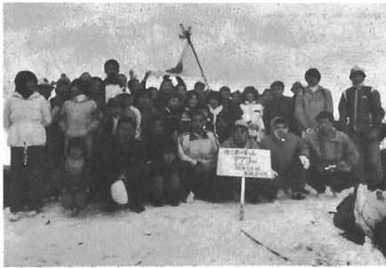
今年のご来光登山のスナップから

で初日を拝み、婆羅尾をまわって下山 午前九時解散の予定 ☆その他①軽食・水筒・電池・ごみ袋等は各自ご持