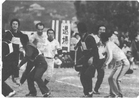
▷ バントタッチまでつづく ガント(地区対抗リレー)

文化の日の十一月三日、恒例の町民体育祭が勝浦中学校グラウンドで開かれました。 前日の雨で一時は開催も危ぶまりましたが、関係者の前夜からのグラウンド整備により、予定どおり開催することができました。 プログラムは、自由参加の借物競争、健康マラソン、ラーメン喰い競争などのほか、老人会、婦人会の競技、また、今年国際障害者年を記念して、身障者会による目かくし競争も行われるなど、みなさんに積極的に参加していただき楽しく終了することができました。 町民体育祭は、地域住民の健康増進と心のふれあいを願って開かれるものです。この日だけは仕事を忘れ、全員が跳んだり走ったりして楽しく過ごしたいものです。 来年も、みなさんの楽しい一日となるようにしたいと思いますので、なおいつそのご協力をお願いします。