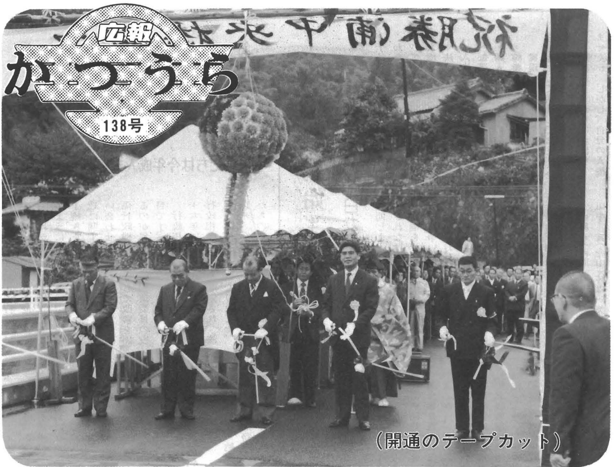
(開通のテープカット)