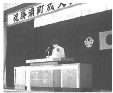
今年行われた成人式

成人式は、ふるさとづくり推進協議会や青年会が出席者の簡素化を呼びかけ「全員洋服の着用」を徹底しております。社会的にも、法律的にも大人としての権利と責任を負うことになる二十歳を祝福する儀式です。成人式の意義を十分理解し、ご協力ください。(勝浦町ふるさとづくり推進協議会)