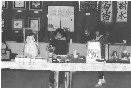
▷今年一月の展示会のもよう