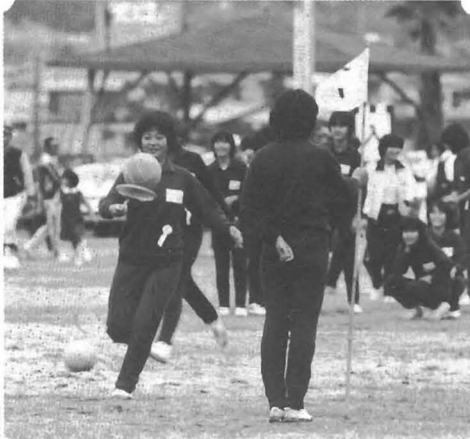
△ きょうは風が強いから落ちないように(スプーンレース)