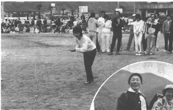
△ 青年会によるゲームリレー なかなか釣れません 私もうイヤ!