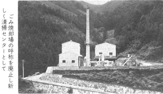
ごみ焼却場の呼称を廃止し新しく清掃センターとして

町議会六月定例会は六月二十日開会。昭和五十三年度一般会計補正予算（六千八百万円を追加）ほか六件を原案どおり可決し、任期満了による各常任委員の選任を行い、六月二十七日閉会しました。