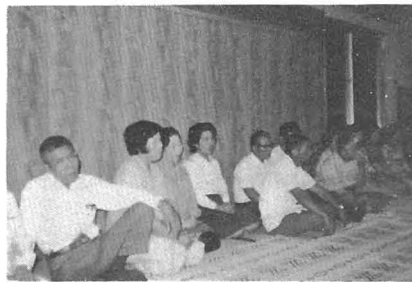
9月17日に行われた横瀬地区における研修会

差別をふれ合う心でなくしようと、これを掲示標語として、町内の公の施設や公会堂等に掲げ、みなさんに実践していただき、歴史的な身分差別によって残されてきたいわれのない差別の解消に、役立てたいと思います。