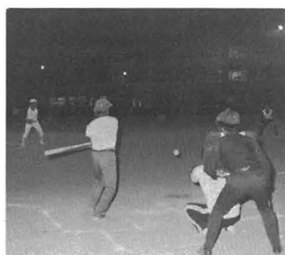
地区対抗三百歳ソフトボール大会

地区対抗三百歳ソフトボール大会が、九月十三日から二十日までの八日間、勝中グラウンドにおいて二十四チームが参加しておこなわれました。