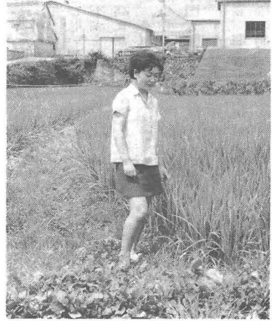
今月の主要作業は、

九月になると、日中は、まだ暑い日が続きますが、夜になると気温は下がり、本格的な秋は真近です。