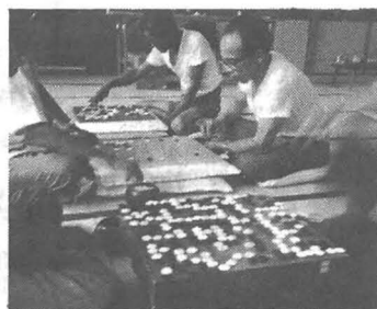
暑さも忘れ白熱戦

さる八月十五日、勝浦町教育委員会主催による、第一回囲碁将棋大会を住民福祉センターに