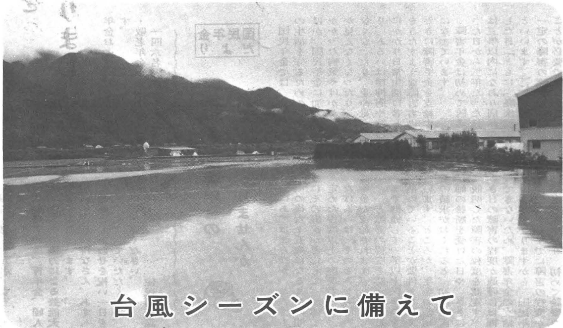
七月の大雨による増水風景