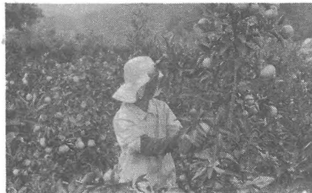
早生みかん採取もさかん

貯蔵みかんの採取は例年十一月下旬より十二月上旬の間が適期であります。未熟果の早取りは貯蔵中の目減りが多くなり、