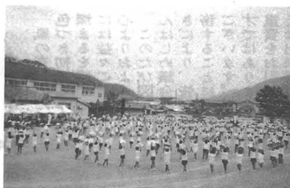
小学校運動会から

ことしの勝浦中学校はいよいよ「石の上にも三年」の年を迎え、文化面、体育面共にその実を上げつつあります。ことに体育面に於ては、町当局および町民の皆様方の深いご理解と絶大なご支援をいただき益々盛んにそして健全に育ちつつあります。本年度も陸上競技の勝小、県大会などを残し殆んどが熱戦の幕をとり、各クラブ共に新チームで次に備えて毎日練習に余念がありません。