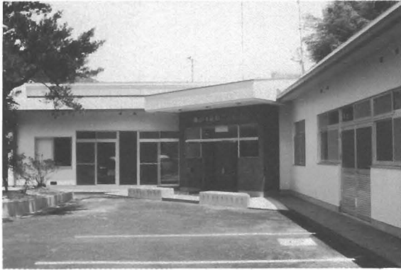
中角の生比奈老人憩いの家跡に完成した農村婦人の家