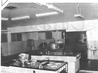
ミンチ製造機や圧力釜を備えた手づくり加工室