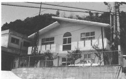
勝浦会館横に新築された教育集会所