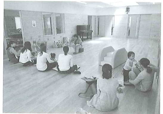
「みんなでお話し(絵本)を聞いたよ!」