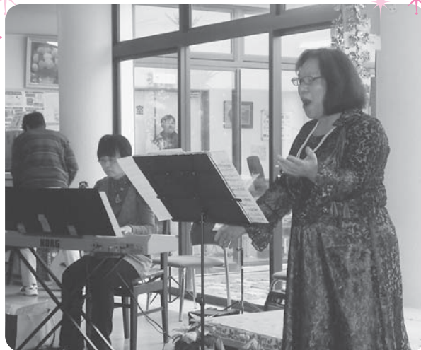
今年のコンサートの様子