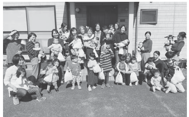
「ハロウィンでお菓子を貰いに、ご近所のお家まで訪問しました!」