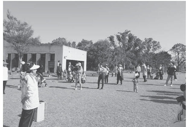
みんなでミニ運動会に参加したよ。 楽しかったね♪

お問い合わせ・お申し込み先 勝浦みかん保育園 ☎0885(42)2246 IP050(3438)9653