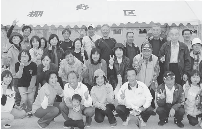
↑優勝した棚野・立川地区の皆さん