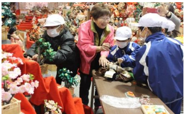
ビッグひな祭り人形飾り付け体験

小学校では、年1回、学校支援に御協力いただいた方をお招きする感謝集会が行われ、児童による感謝状の贈呈や学習の成果発表が行われている。