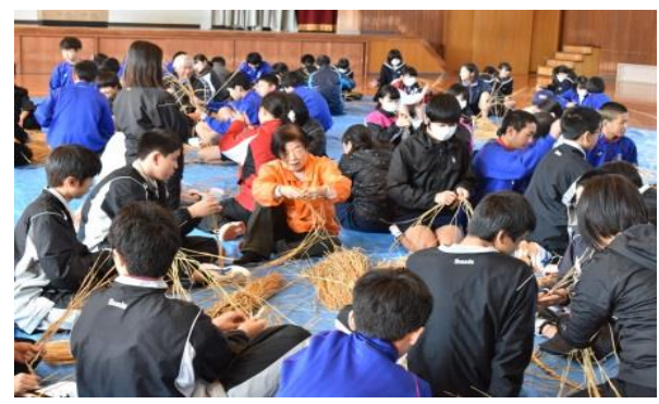
しめ縄づくり体験