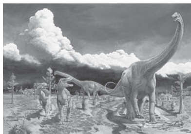
丹波の復元画:小田隆/丹波市