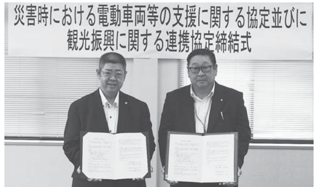
観光振興に関する連携協定