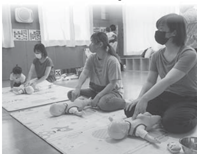
「救急救命士による講習を受けました。」