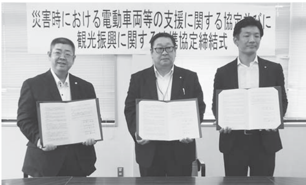
災害時における電動車両等の支援に関する協定

カイレンタカー四国(株)および(株)日産サティオ徳島と連携し、適切に配備していきます。また、同日に勝浦町・スカイレンタカー四国株式会社と観光振興に関する連携協定書を締結しました。この協定は、スカイレンタカー四国(株)が有する知見や物的資源等と勝浦町が有する豊かな観光資源等を有効に活用した観光振興に係る取組等について連携・協力して、観光振興による地域の活性化を図ることを目的とするものです。協定の締結により、町の観光産業が活性化されるものと期待しています。