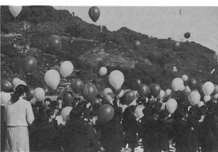
▲メッセージをつけた風船が一斉に放され、大空へ舞い上がりました