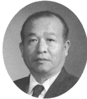
勝浦町長 桜木 義夫