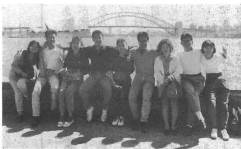
▲オペラハウスとハーバードブリッジをバックに

現在、オーストラリアにとって日本は最大の貿易国であり、今後二か国間の関係は、経済、商業、文化を中心に一層堅固なものとなるでしょう。そのためにも、自国を知りまた相手を理解する事が大切だと思います。短い期間でしたが、開放的で、のんびり屋、人なつっこく、気さくでどこへ行っても気軽に話しかけてくれるやさしい人々、市街地から一時間も自動車を走らせればコアラ、カンガルーが生息しているという大自然、私にとって魅力いっぱいのおーストラリアが大好きになりました。今では、南半球のオーストラリアが距離感がなく身近に感じられます。最後になりましたが、皆様大変お世話になり本当にありがとうございました。