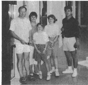
▲ステイ先のファミリーと

さっそく車に乗り込みました。聞いてみると親せきの娘さんの二十一歳の誕生日で、娘さんのボーイフレンドの家でパーティーがあるらしい。オーストラリアでは二十一歳で成人し、日本のように式典のようなものはなく、知人友人が集まってパーティーをするらしい。行ってみると、家の庭にテーブルが用意してあり、五十人くらい集まっていました。その中には、お互いの両親も出席して娘さんを囲んで楽しく話をして祝福していました。