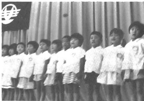
横瀬保育所園児が歌・遊戯で出演

九月十五日は「敬老の日」。この日、午前十時から勝浦中学校体育館に七十歳以上のお年寄り六百人を招いて、第十五回敬老町民のつどいが開催されました。