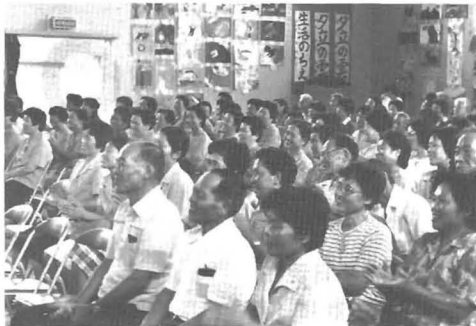
児童の自慢話に笑顔のこぼれるおじいさん・おばあさん

九月六日、横瀬小学校で老人参観日が実施されました。当日午後一時五〇分から各教室において授業参観がありその後十二人の児童代表がこの夏に体験した自慢話を発表しました。会場につめかけた約一六〇人のおじいちゃん、おばあちゃんは孫たちの自慢話に顔をほころばせ聞かいていました。会場には夏休み中の作品が展示され楽しい参観日でした。