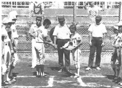
東京港区チームと勝浦タイガース

炎天下、30名の子供たちが心をひとつに、汗を流し、声をからして、共に手にした花子供らしい、さわやかな落成記念になったのでは……。