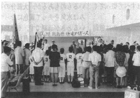
写真/ 試合風景とイーグルスチームに観迎される勝浦タイガースのナビッコたち