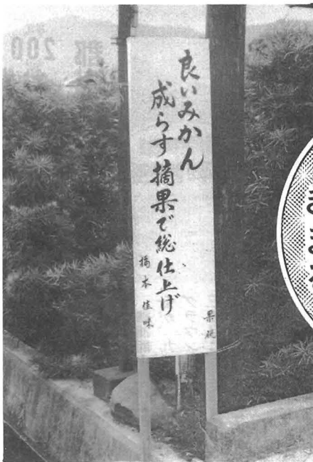
写真は摘果推進標語の立て看板

本年産のうんしゅうみかんも大豊作が見込まれ、果樹経営は重大な事態に直面しています。 このため、全国的な問題として二割減産の摘果推進を行う生産安定事業が実施され、本町も両農協が中心となって摘果を推進し、ご協力を願っておりますが、その事業の啓もうと強力な推進をはかるため、勝浦中学校生徒を対象に摘果推進標語を募集しました。一、二九二題の応募の中から厳正な審査の結果、つぎの標語が入選しました。