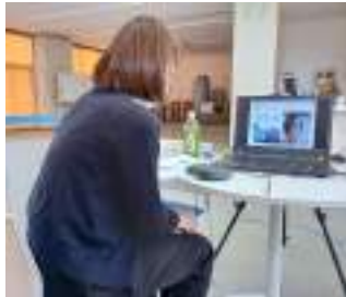
▲オンライン講義の様子

5月8日（水）には、県外大学の講義において外部講師として講演をさせていただきました。講義では、勝浦町の恐竜資源を用いた地域おこし活動のうち、“関係人口”を増やすことにつながる活動についてお話しさせていただきました。勝浦町で行っている活動が皆様の今後の活動の参考になれば幸いです。