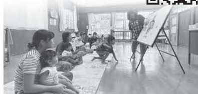
「さかながはねてびょん!!何になったかな?」