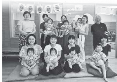
「民生委員さんとの夏祭り」