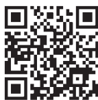
専用アプリ等の詳細

災害はいつ起こるかわかりません。ぜひ、ご登録をお願いします。専用アプリダウンロード等の二次元コードは、広報紙裏面に掲載しています。