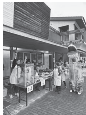
【10月26日にみんなの運動会2025に出店しました】