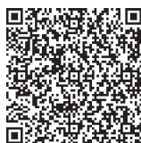
胃内視鏡検診 申込用