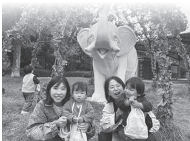
[ぞうさんとハイチーズ。]