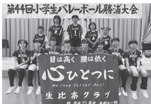
勝浦大会で活躍した生比奈クラブ

大会を通して、選手の皆さんの笑顔と成長が光る一日となりました。生比奈クラブの皆さん、本当におめでとうございます。今後ますますのご活躍を期待しています。