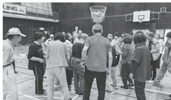
【9月25日に障がい者・高齢者スポーツ大会が行われました】