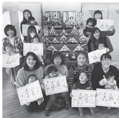
「世界にひとつのひな飾りができました。」