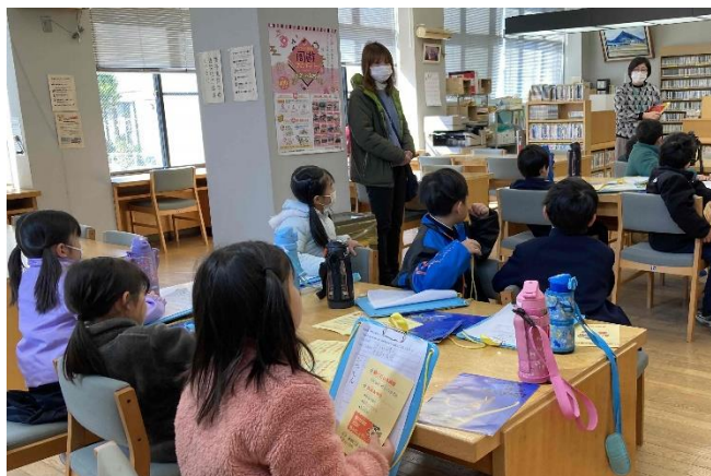
小学生の図書館見学 (勝浦町図書館)