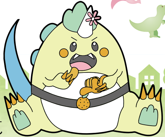
勝浦恐竜 キャラクター カイくん