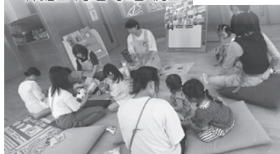
こあら組さんと交流