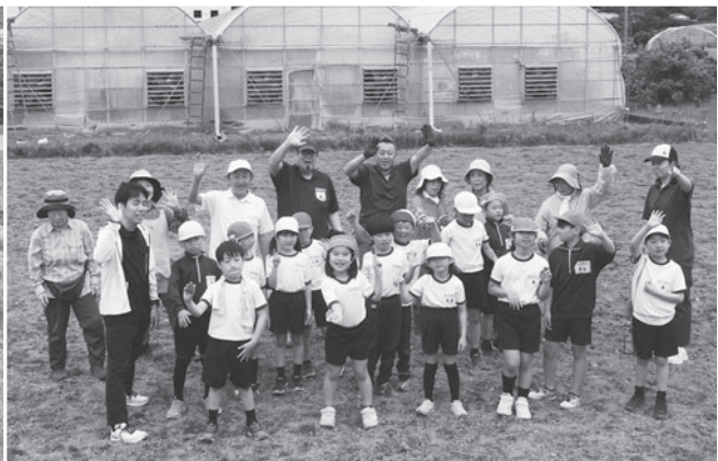
ひまわりの種まき