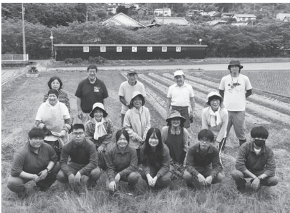
さつまいも苗の定植

6月4日(木)道の駅周辺の畑で、小松島西高等学校勝浦校応用生産科2年生の皆さんとNPO法人阿波勝浦井戸端塾、NPO法人KIFriendsの皆さんでさつまいも苗の定植を行いました。一つずつ苗を定植し、藁を敷いて丁寧に植えましました。収穫は、地域住民や地元団体等との交流の機会となるよう、大切に活用していきます。