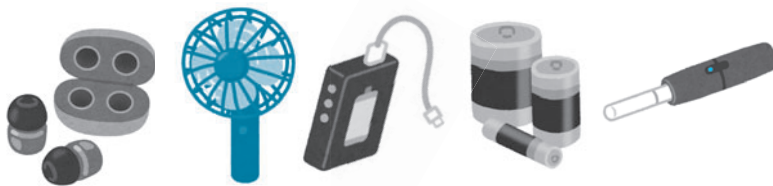
製品の一部例：ワイヤレスイヤホン、電子タバコなど

収集車の車両火災が発生すれば、長期間にわたり、ゴミ収集事業に極めて大きな悪影響を及ぼしますので、 絶対に燃えるゴミ袋に入れしないでください。