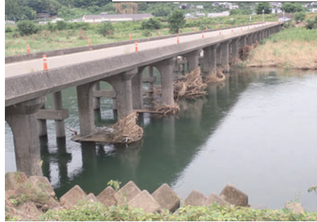
洪水の痕跡(星谷側から)

時には地元消防団による通行止め作業が必要となるなど、橋の重要度や安全安心の観点から、優先的に対策を講ずる必要があります。