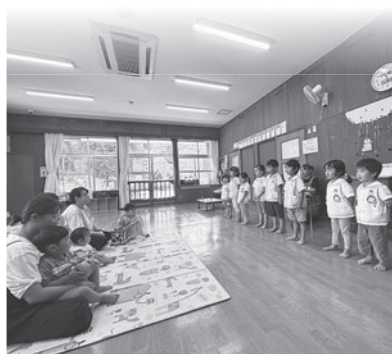
かわいい歌声で“とけいのうた”を聞かせてくれました。